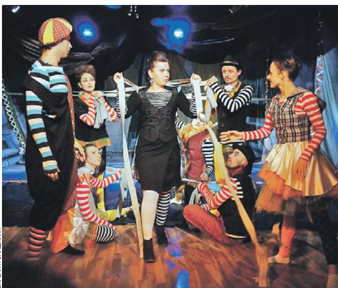
3 апреля 2016 года 19:30 Премьера спектакля «Та, которая впервые узнала, что такое дождь» в театре «Недослов»

В театре «Недослов» 3 апреля прошла премьера спектакля «Та, которая впервые узнала, что такое дождь». И хотя здесь играют лишь неслышащие актеры, это ничуть не помешало зрителям почувствовать свою сопричастность к происходящему на сцене. Спектакль, поставленный по новеллам Леонида Енгилбарова, клоуна-мима, рассказывает о любви. О том, как главные герои — Он и Она — не сумели ее разглядеть, а полюбили — сохранить свои чувства.