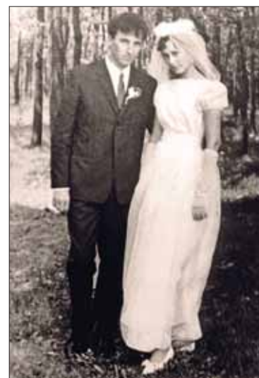
Свадьба, 1969 год. А после торжества – свадебное путешествие с берегов Днепра к берегам Амура