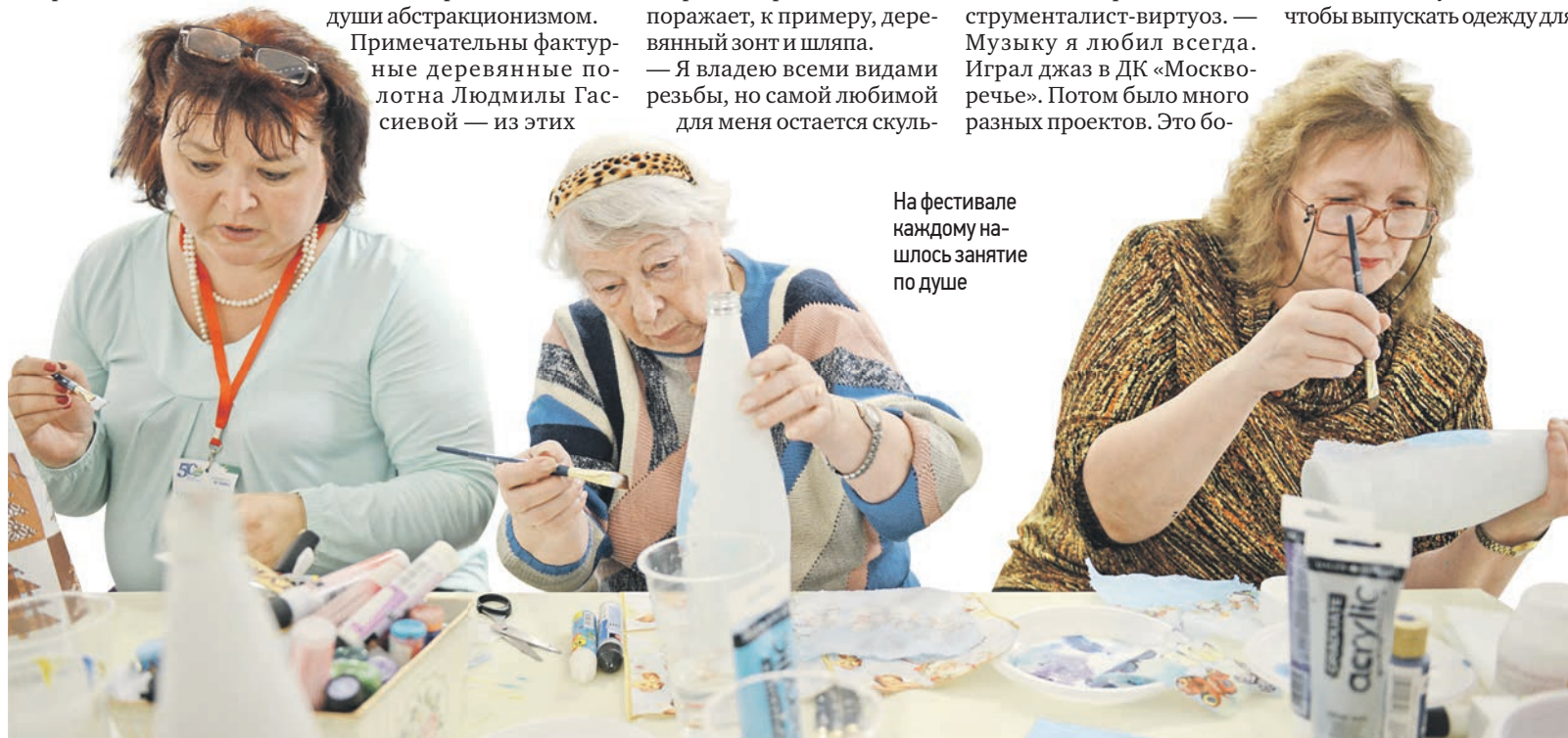
На фестивале каждому нашлось занятие по душе

Я считаю, что проект «50 ПЛЮС» очень важен. Должна быть государственная программа, в которой будет прописано, что зрелый возраст самый благоприятный для реализации человека — он может поделиться накопленными знаниями и опытом, трудиться не только для себя, но и для общества.