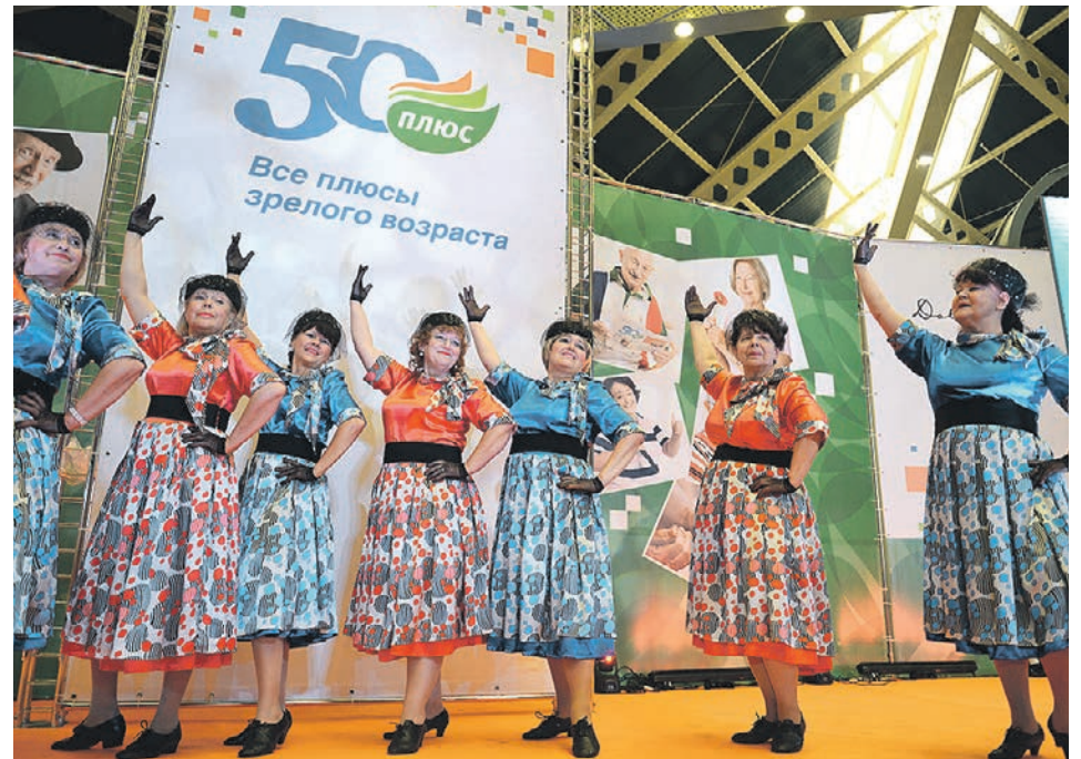
Участники фестиваля «Пятьдесят плюс» разом почувствовали себя помолодевшими...