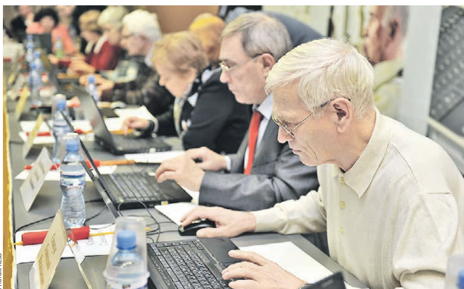
Компьютерные клубы в столице набирают все больше популярности. Многие оценили, что некоторые вопросы лучше всего решать в Интернете. Вон сколько существует удобных городских порталов!