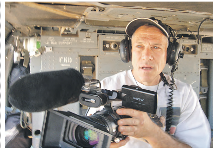
Американский кинодокументалист Джон Апперт прославился своими интервью с Фиделем Кастро и Саддамом Хусейном

Проект «Мушкетеры, вооруженные неограниченными возможностями журналистики», направленный на улучшение освещения в СМИ проблем инвалидности. Реализуется Городским общественным телевизионным центром (Нью-Йорк, США), Центром развития журналистики (Москва), телекомпаниями «Радо-нежь» (Сергеев Посад) и ТВК (Красноярск). Проект поддержан российско-американской программой «Обмен социальным опытом и знаниями» и программой российского-американского партнерского диалога. Известный российский хоккеист Вячеслав Фетисов помог приобрести видеокамеры, на которые участники снимают свои сюжеты.