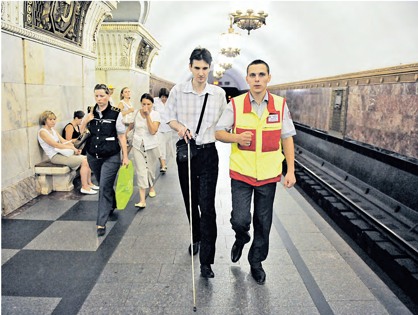
31 июля 2014 года. Сотрудники Центра обеспечения мобильности пассажиров Московского метрополитена помогает незрячему москвичу сесть на нужный поезд. Услугами центра абсолютно бесплатно может воспользоваться любой человек с ограничениями по здоровью