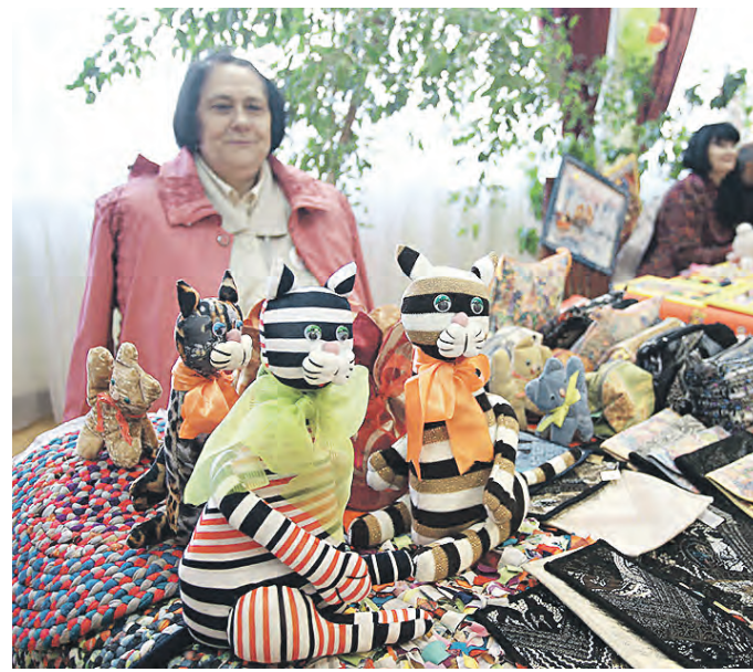
Очень скоро достижения пока еще не признанных мастеров получат постоянную прописку на территории нынешней ВДНХ