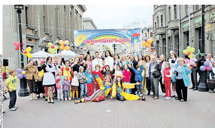
28 августа 2014 г. Участники общегородской акции на Старом Арбате

В канун учебного года в столице прошла 9-я общегородская благотворительная акция «Семья помогает семье: соберем ребенка в школу!». В ней приняли активное участие около 90,2 тысячи горожан, а также 645 коммерческих и общественных организаций и благотворительных фондов. Для этого 28–29 августа были открыты 168 передвижных и 152 стационарных пункта по сбору благотворительных пожертвований. В общей сложности было собрано свыше 8 тонн одежды, более 3 тысяч пар обуви, 28 090 школьных ранцев, 253 единицы спортивного инвентаря, 416 единиц бытовой техники, почти 8 тысяч книг и более 496 тысяч канцтоваров.