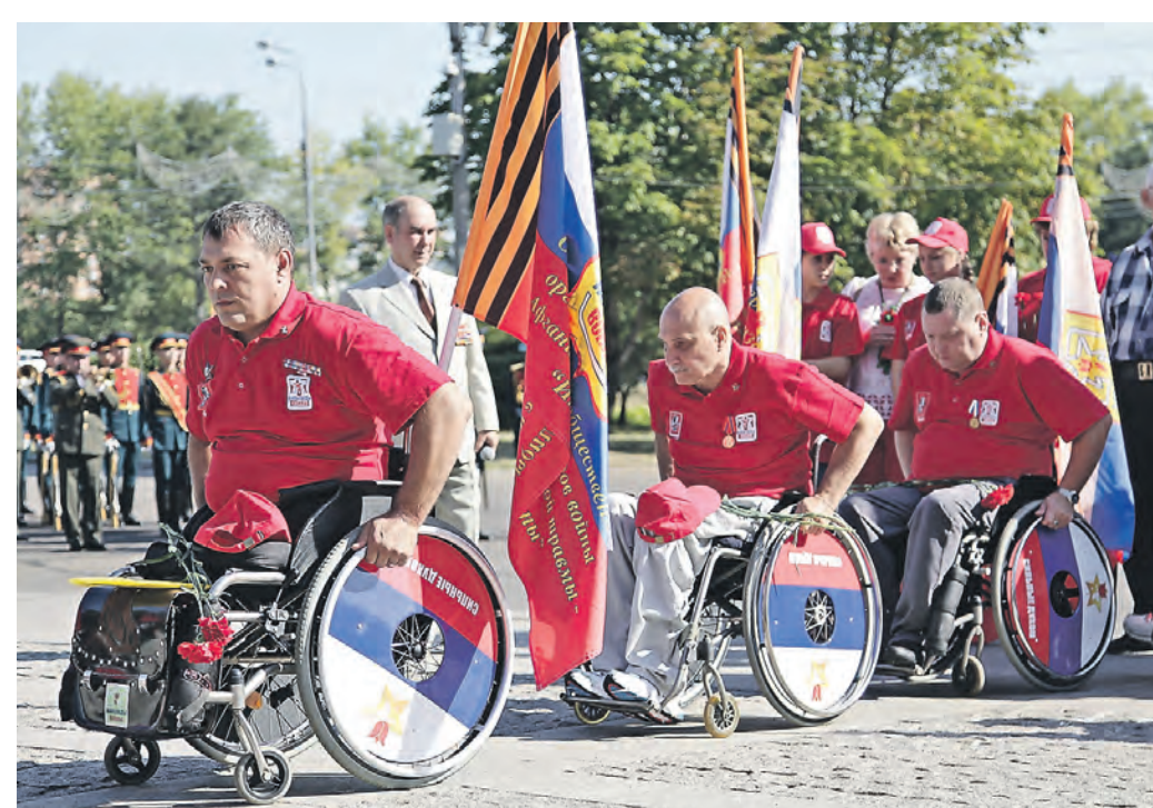
31 июля 2014 г. В Парке Победы девять сильных духом инвалидов-колясочников начинают свой тысячекilометровый марафон, посвященный 70-летию решающих битв в Великой Отечественной войне