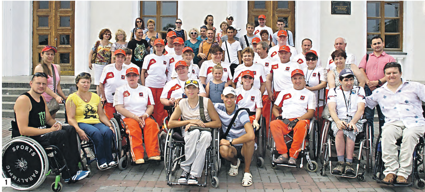
1 19 июля 2014 г. Фотография всех участников автопробега в заповеднике «Херсонес Таврический» в городе-герое Севастополе 2 Долгожданное ожидание острова: переправа на пароме в Крым 3 Остановка на обратном пути у храма Святого Николая, который величественно возвышается над Керченским проливом

Колонна из девяти автомобилей с ручным управлением проехала по маршруту Москва — Елец — Каменск-Шахтинский — Краснодар — Темрюк — Керчь — Симферополь — Севастополь. Позади не одна тысяча километров. Десятки сел, городков и городов. И множество встреч. А значит — знакомства, разговоры, обмен адресами, впечатлениями, опытом. Потрясающее расширение горизонтов... И у кого теперь повернется язык назвать этих людей маломобильными? В Крыму участники автопробега встретились также с руководством муниципалитетов, отвечающих за социальный блок и развитие туризма, и с представителями обще-