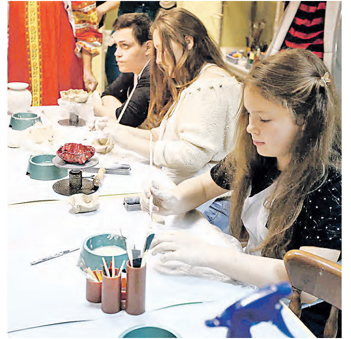
4 сентября 2014 года. Воспитанники центра могут выбирать мастерские по вкусу: здесь они занимаются росписью по дереву

Именно так звучит девиз Реабилитационного центра для инвалидов «Ремесла», который торжественно открыли в Зеленограде под русские народные песни и игры. Ведь центр не случайно назван старым словом «Ремесла». Ибо умение что-то делать своими руками ценилось во все времена. И в наш век высоких технологий — тоже. Что и доказала благотворительная ярмарка «Поможем ребенку-инвалиду собраться в школу», на которой были представлены работы воспитанников центра. Поделки из дерева, глины, разнообразные текстильные изделия и многое другое раскупалось быстро. Помочь себе и другим — что может быть лучше?