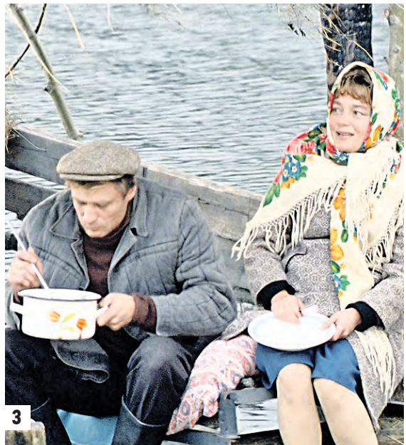
Закладочный текст тифлокомментатора: Петруха наклоняется к товарищу Сухову: «У Абдуллы много людей, они убиты нас!» (1) Екатерина оторвалась от журнала, посмотрела на севшего напротив мужчину: «Мне нет никакого дела до ваших ботинок» (2) Василий хлебает борщ половником прямо из кастрюли, Надя держит крышку на коленях (3)

■ ОЛЕГ ГОВОРОВ oleg.govorov@vm.ru Кропотливая работа по созданию безбарьерной городской среды продолжается. Разговоры о значении самого слова «барьер» и о технических параметрах — уже в прошлом. Сегодня пришла очередь штурмовать и незримые, информационные барьеры. Если вы уже слышали о телевидении для слабослышащих или даже совершенно слепых людях или о кинотеатрах со специальным оборудованием для них же, тогда вам знаком термин «тифлокомментарий». Но тем, кто впервые услышит это слово, поясним: тифлокомментарий — это целевая информация, подготовленная для слепых или слабослышащих для замещения или дополнения визуальной информации. Той, которую зрячие воспринимают легко и естественно. Люди постарше хорошо помнят радиорепортажи, например, со спортивных состязаний