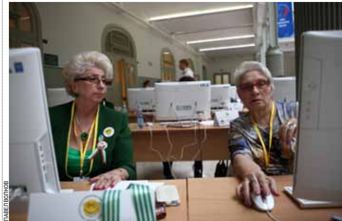
23 сентября 2014 года. Участники Всероссийского чемпионата по компьютерному многоборью к началу состязаний готовы

Почти 200 москвичей старшего поколения примут участие в чемпионате по компьютерному многоборью, который состоится 18 мая в конгресс-центре гостиничного комплекса «Измайлово». Чемпионат проводится в три этапа. Первый в центрах соцобслуживания и пансионатах для ветеранов войны и труда. Второй, отборочный тур, пройдет в управленческих подразделениях населения 11 административных округов города Москвы. Третий этап — общегородской финал, победители которого поедут в Но-