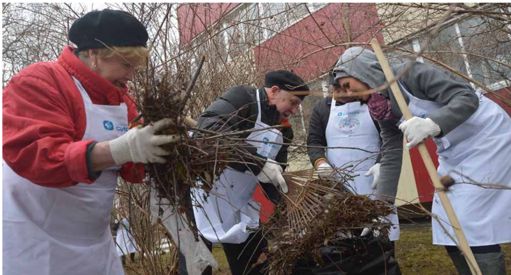
23 апреля 2016 года. Пансионат «Коньково» для ветеранов войны. Волонтеры благотворительного фонда «Система» и ветераны на уборке территории

ЧИСТОТА В пансионате «Коньково» для ветеранов войны, с наступлением апреля прошел субботник, в котором участвовали волонтеры из благотворительного фонда «Система» и делегаты городского совета ветеранов.