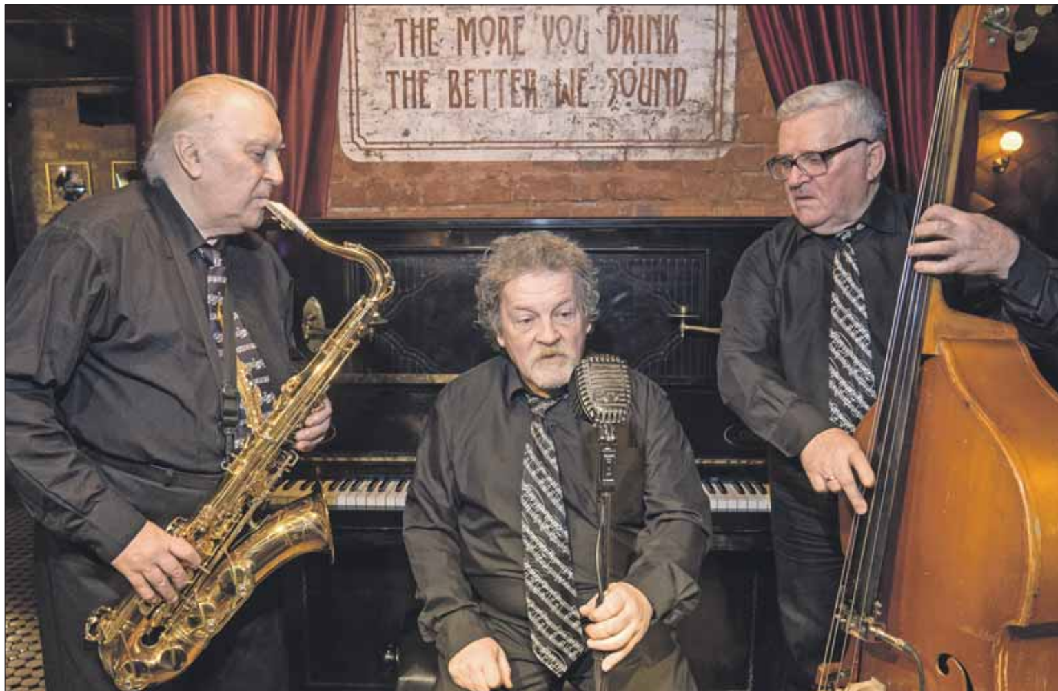
Лауреаты Московского Фестиваля молодежи и студентов 1957 года и первых столичных джаз-фестивалей 1962–1967 годов

– В ноябре прошлого года нас пригласили на встречу с участниками «долголетия». Мы получили огромное удовольствие. Столько заряженных позитивом людей красивого возраста. Энергия была потря-