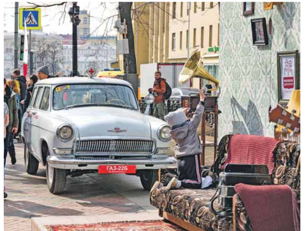
Ретро «скорая помощь» и ретроквартира на ретросубботнике