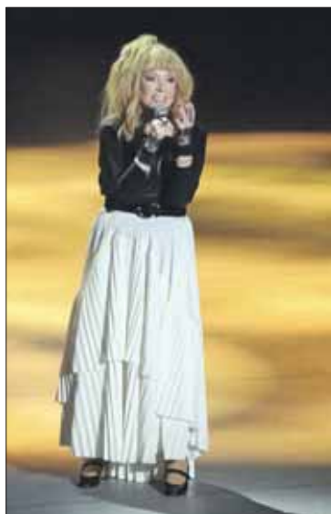
15 апреля 2019 года 70-летний юбилей отметила примадонна российской эстрады Алла Пугачева.

Юбилей. Участники проекта «Московское долголетие» посетили юбилейный концерт примадонны российской эстрады