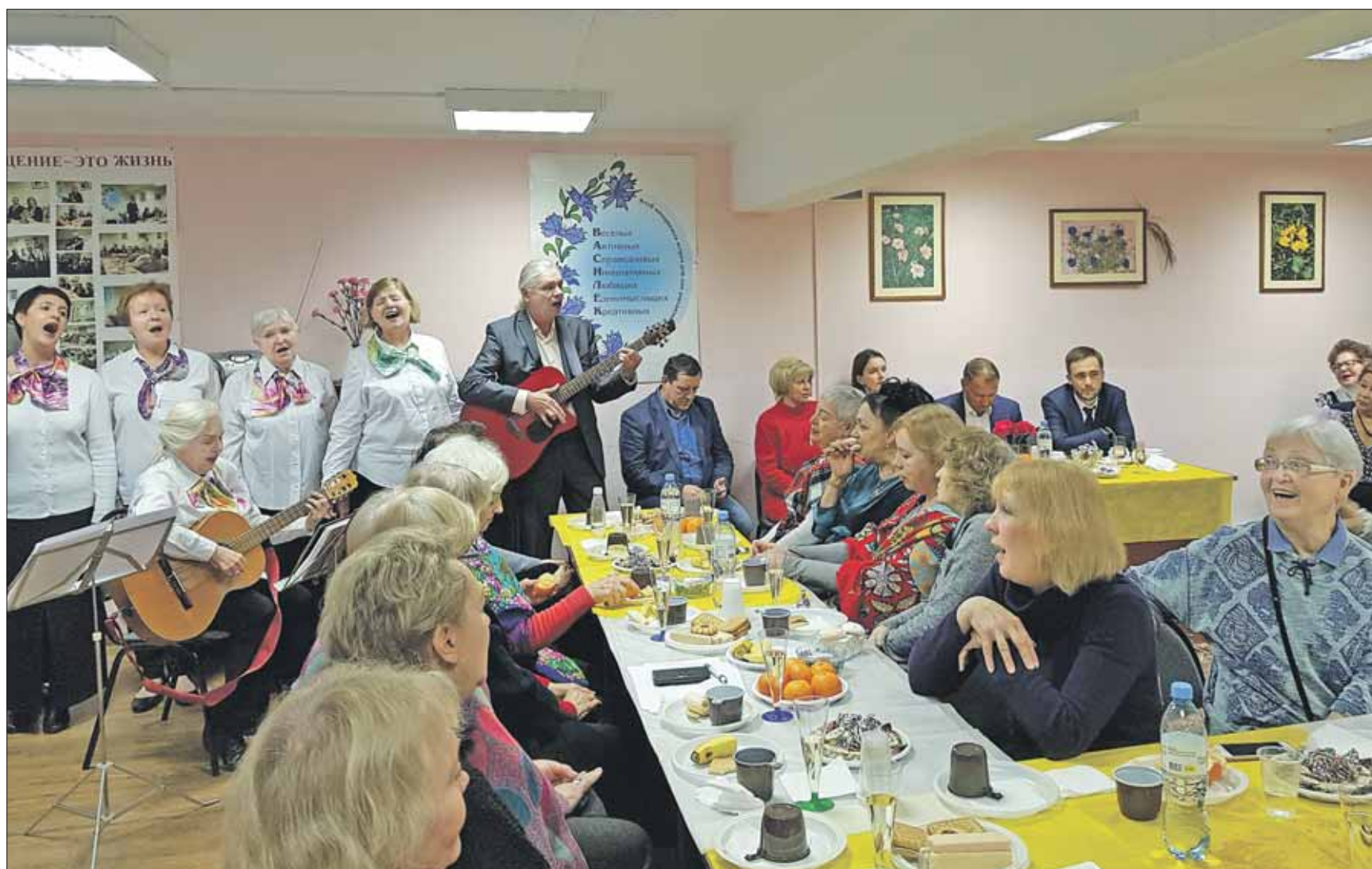
Клуб «Василек» – это место знакомств, интересных событий, которые поднимают жизненный тонус

В ПРОЕКТЕ «МОСКОВСКОЕ ДОЛГОЛЕТИЕ» НАРЯДУ С ТРАДИЦИОННЫМИ ТЕМАТИЧЕСКИМИ КРУЖКАМИ ПОЯВЛЯТСЯ И НОВЫЕ НАПРАВЛЕНИЯ. ЭТО БУДУТ СВОЕГО РОДА КЛУБЫ ДЛЯ СТАРШЕГО ПОКОЛЕНИЯ «ИНТЕЛЛЕКТУАЛЬНАЯ БЕСЕДКА». ПЛАНИРУЕТСЯ ОТКРЫТЬ ДИСКУССИОННЫЙ КЛУБ ДЛЯ ОБСУЖДЕНИЯ ФИЛЬМОВ И КНИГ, ПОЭТИЧЕСКИЙ КЛУБ. В КЛУБЕ ВОЛОНТЕРОВ БУДУТ СОБИРАТЬСЯ ТЕ, КОМУ НРАВИТСЯ ДЕЛАТЬ ДОБРО, ОКАЗЫВАТЬ ПОДДЕРЖКУ НУЖДАЮЩИМСЯ