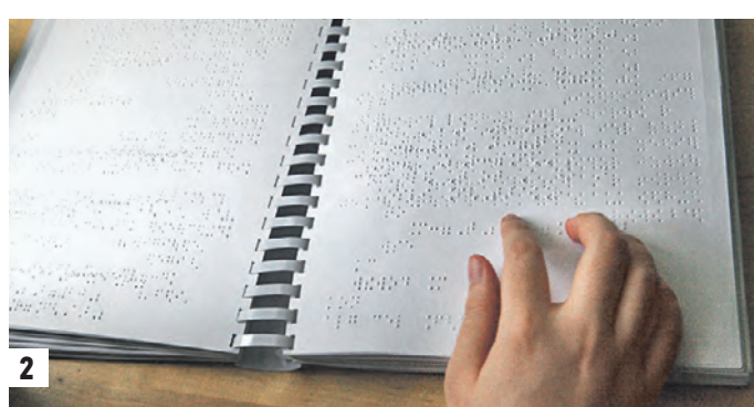
2 апреля 11:45 Ученица первого класса школы-интерната для слепых обучающихся № 1 Юлия Гиднева на уроке тифлографии (1) Учебник математики, написанный на азбуке Брайля. Этот алфавит — «проводник» в окружающий мир для людей, которые не видят (2) В школе-интернате учат ориентироваться с помощью различных систем (3)