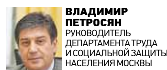
ВЛАДИМИР ПЕТРОСЯН РУКОВОДИТЕЛЬ ДЕПАРТАМЕНТА ТРУДА И СОЦИАЛЬНОЙ ЗАЩИТЫ НАСЕЛЕНИЯ МОСКВЫ

Старшее поколение — это золотой фонд Москвы. Участники форума на своем примере каждый год показывают, что и на пенсии можно жить ярко и интересно. Считаю, что современная молодежь должна учиться у представителей возраста 50+ оптимистичному настрою и искреннему интересу к жизни.