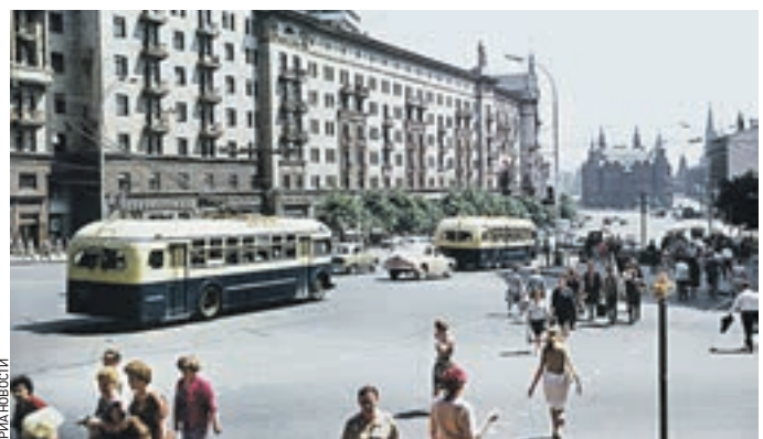
Фото 1966 года. Улица Горького всегда была оживленной. Жизнь на ней в бунвальном смысле слова кипела. Фильм это покажет