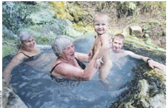
В прошлом году почти 140 тысяч москвичей воспользовались санаторно-курортным лечением

Со стандартами санаторно-курортной помощи, в рамках которых осуществляется лечение в санаториях, и перечнем здравниц, предоставляющих услуги по санаторно-курортной помощи, можно ознакомиться в разделе «Информация о путевках» на сайте Департамента социальной защиты населения города Москвы: www.dszn.ru . В прошлом году более 138 тысяч москвичей из числа льготных категорий воспользовались санаторно-курортным лечением. В первом полугодии 2015 года оздоровились уже более 76 тысяч человек, в том числе в санаториях Крыма.