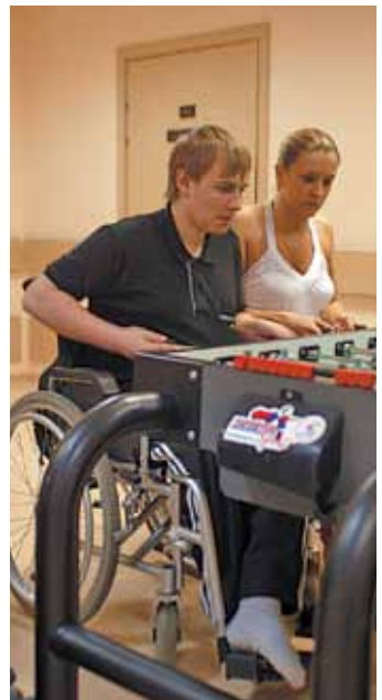
Идут соревнования по настольному футболу

большого детского праздника в торгово-развлекательном центре «Атриум», с которым наш фонд также связывает хорошие партнерские отношения, мы уже не раз проводили там веселые развивающие праздники для ребят-инвалидов из детских домов и домов-интернатов. Будет большая программа, концерт, игры, сладкий стол, подарки от нашего фонда. Это будет не один праздник, а каждые выходные в мае — детские праздники с аниматорами, развлечениями, угощениями, и к 1 июня, Международному дню защиты детей, устроим гала-концерт с подарками. Скоро в Москве состоится гастроли Чикагского симфонического оркестра, их концерты будут проходить в Консерватории им. П. И. Чайковского и Большом зале филармонии, с ограниченными возможностями здоровья. Нам удалось договориться о выступлении солистов этого замечательного оркестра в РЦ «Преодоление» — несколько человек, квартет или квинтет специально приедут к нашим инвалидам-колясочникам, чтобы сыграть для них. Также в конце апреля в восьмой раз пройдет наш ежегодный шахматный турнир на призы фонда «Независимость» для детей-инвалидов из коррекционных школ Москвы. И, конечно же, мы обязательно поздравим наших подопечных ветеранов Великой Отечественной войны с Днем Победы — это наша традиция, нарушаемая и постоянная. Помощи много не бывает, она никогда не будет лишней, любое доброе дело, сделанное от души, обязательно найдет отклик в душах людей, поможет сделать этот мир добрее и гуманнее...