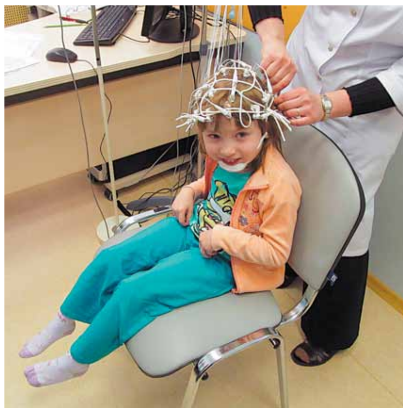
В Центре реабилитации детей с ДЦП используют самые современные методики и технологии