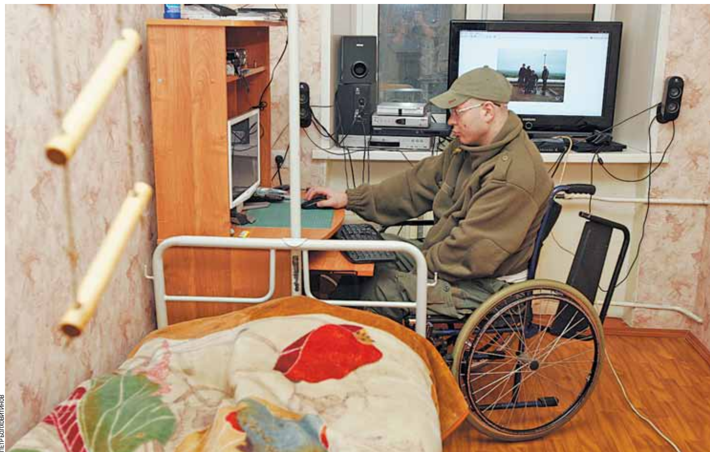
Без Интернета их жизнь и представить сегодня невозможно

Итак, по запросу «инвалиды» Гугл выдал список из 5 миллионов ссылок. Самый первый сайт: www.invalirus.ru, Всероссийский сайт инвалидов. Заставка в нежных тонах с цветущей вишней и надписью «Весна идет, широко шагая». И — куча самых разнообразных разделов. Как и на многих подобных порталах, здесь есть форум, чат, опция «найти друга», раздел знакомств — словом, все что нужно для веселого трепа. Однако есть и специфика. Например, в разделе «Информация» можно узнать о клиниках, реабилитационных центрах, новых технологиях в области медицины — протезировании, клеточной хирургии. Истории из жизни — о том, как это случилось, как здоровый человек стал инвалидом. Интересный опыт — путешествие без сопровождающего: девушка-колясочница проехала по маршруту Улан-Удэ — Новосибирск — Новокузнецк. Одна. А вот парень с недоуменным вопросом: почему на форуме запрещены темы о том, кто как зарабатывает? «Труд — это единственное, что может поддерживать человека, когда все рушится», — пишет он.