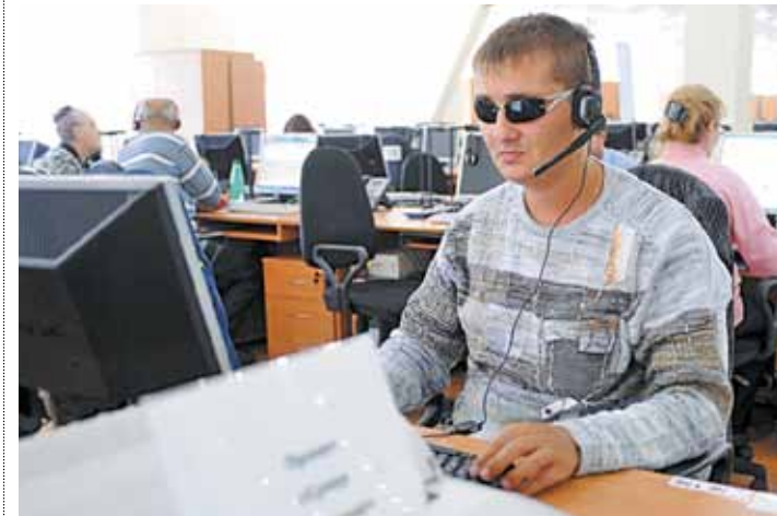
Найти работу инвалидам в Москве становится проще

Префектурами административных округов и управками районов ежегодно проводятся работы по приспособлению квартир инвалидов-колясочников и входных групп подъездов, в которых они проживают, а также прилегающих дворовых территорий. В 2011 году приспособление квартир инвалидов велось не только префектурами административных округов, но и за счет программных средств, предусмотренных Департаментом социальной защиты населения. По итогам года в рамках программы приспособлено 168 квартир инвалидов. Успешно реализован пилотный проект по установке поточной подъемной рельсовой системы в 190 квартирах лиц с тяжелыми ограничениями в передвижении. Разработаны новые архитектурно-технические решения по переустройству квартир на первых этажах серий массового строительства для проживания в них инвалидов-колясочников, с учетом всех существующих нормативных требований по обустройству таких квартир. В 2011 году были продолжены работы по обустройству улично-дорожной сети. В 2011 году на улицах города оборудовано 43 689 ступенек с тротуара на проезжую часть для удобства слабовидящих лиц и инвалидов-колясочников. Проводились работы по приспособлению для инвалидов подземных пешеходных тоннелей и общественных туалетов.