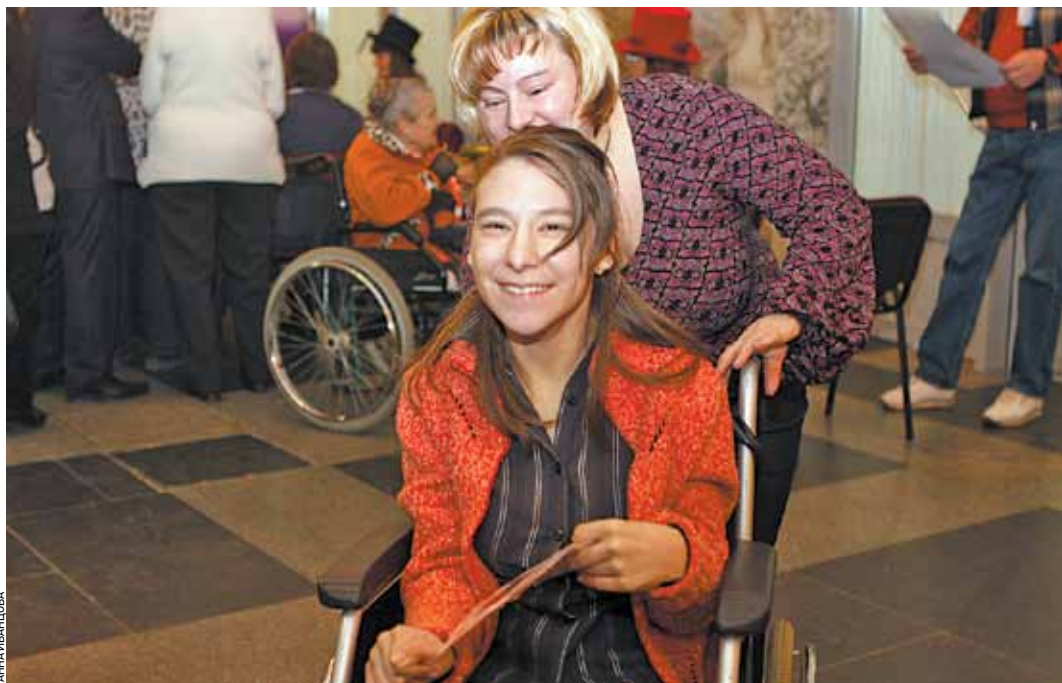
Для многих подопечных социальные работники становятся самыми близкими людьми

Различные, право же, не столь существенные — ведь важнее то, что очень близки и схожи задачи, роль, служение социальных работников и у нас, и у них. Это — помощь бездомным и престарелым, инвалидам, сиротам и многодетным, поддержка людей, оказавшихся в трудной жизненной ситуации. И неважно, в какой части света они живут, на каком языке говорят — слова «забота», «милосердие»,